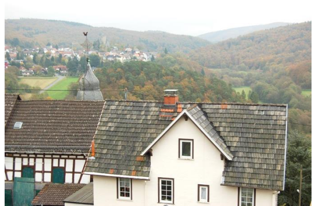
Blick vom Schloss auf das Weiltal.