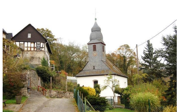
Die ev. Kirche von Neuweilnau.

In dem Schloss sind Büroräume der Forstverwaltung Hessen und ein Trauzimmer untergebracht. Bei Bedarf werden die Räumlichkeiten auch vermietet.