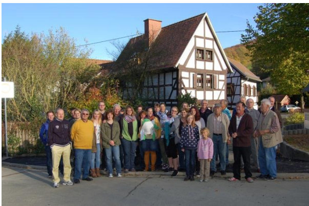
Ca. 30 Bürgerinnen und Bürger nahmen an der lokalen Veranstaltung teil.