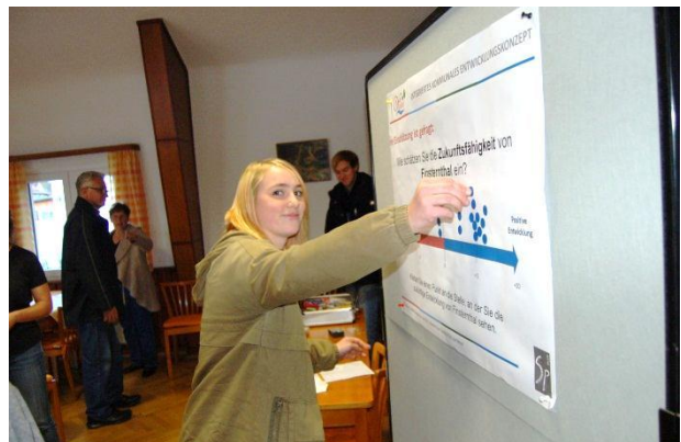
Im Anschluss an den Workshop bewerteten die Bürgerinnen und Bürger die Zukunftsfähigkeit ihres Ortsteils.